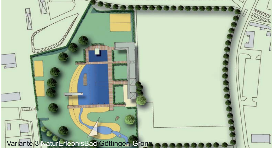
Variante 3 NaturErlebnisBad Göttingen-Grone