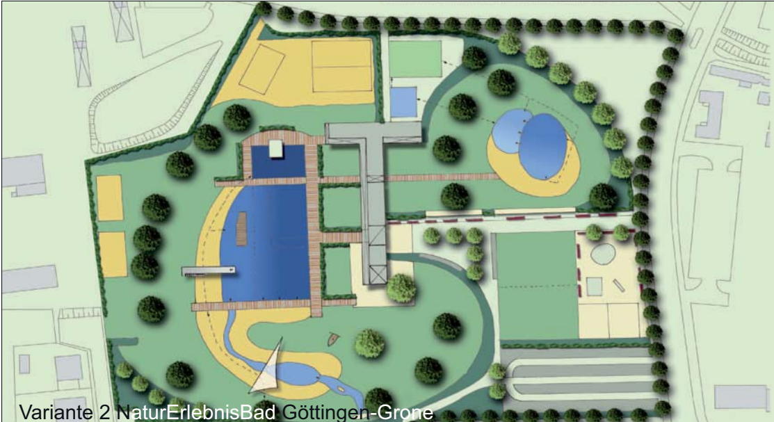
Variante 2 NaturErlebnisBad Göttingen-Grone